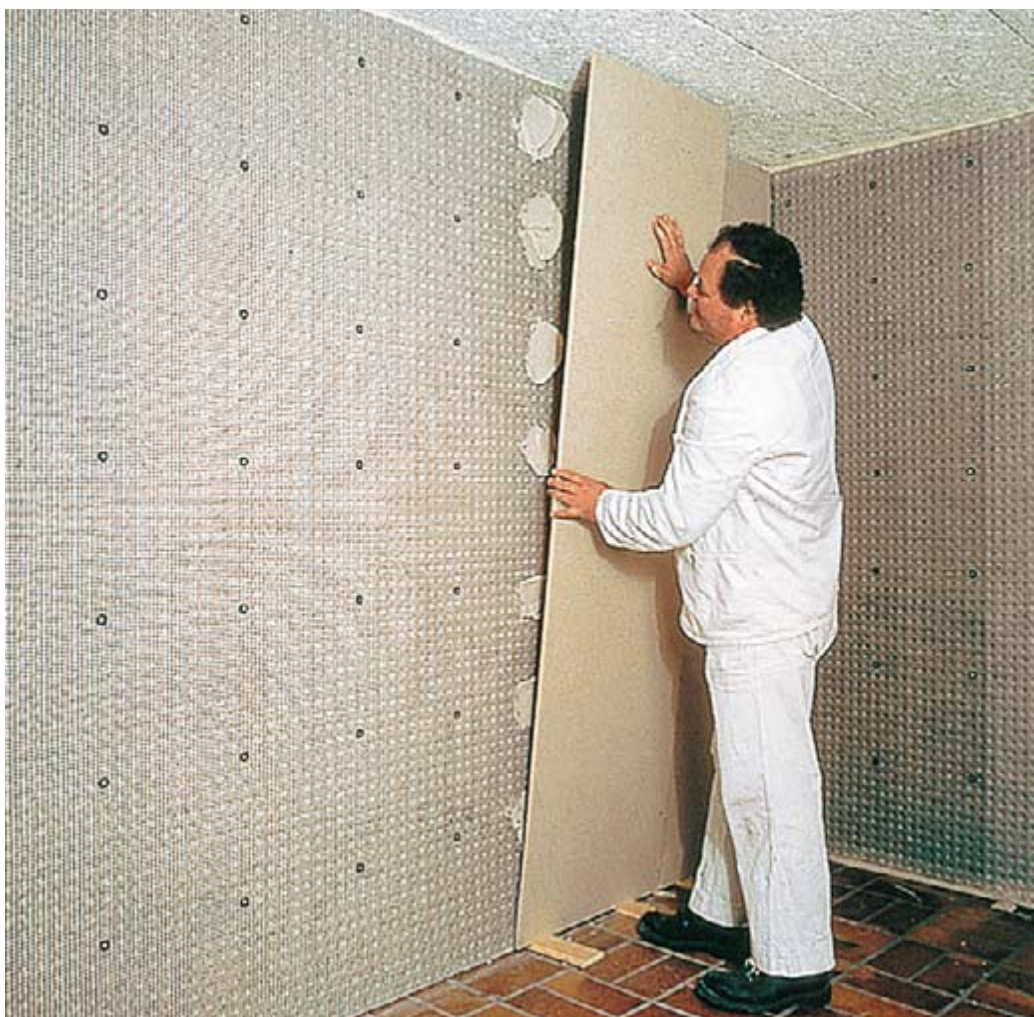
DELTA®-PT bildet eine wasserdichte und stabile Basis für Gips- und Kalkzementputz oder Gipskartonplatten.