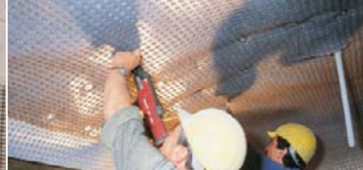
Leichte Befestigung auf der Wand.