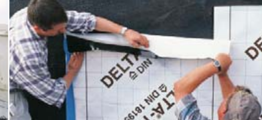
Zuverlässiger Schutz von Kellerwänden.