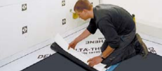
Schnelle Verarbeitung von der Rolle.