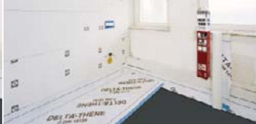
Sichere Abdichtung in Nassräumen.