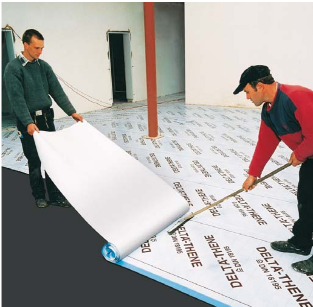
Große Flächen können mit DELTA®-THENE ganz einfach und ohne Unebenheiten abgedichtet werden.